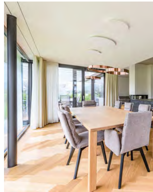
Der moderne Baukörper beinhaltet sorgfältige Zimmererarbeiten der Firma Rückenbach Holzbau GmbH.