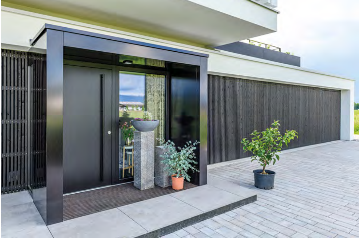
Schon beim Eingangsbereich herrscht Klarheit der Zonen dank Pflasterarbeiten von Thomas König Meisterpflaster.

Unfassbar elegant wirkt das Biarritz-weiße Haus im Grün des Dreiländerecks am Bodensee. Verglasungen bilden den transparenten Sockel für das scheinbar schwebende Obergeschoss, dessen vertikale Alulamellen für eine dynamische Performance sorgen. Rasant und klar, groß und modern sind die passenden Adjektive für das Domizil der jungen Bauherren. Für die individuelle Formensprache des klug geplanten Objektes zeichnen die renommierten Dornbirner heim.müller.partner Architekten verantwortlich.