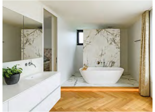
Wohntraum in Weiß: Beschichtungen im Sanitärbereich und in der Garage setzte die Firma Scheiber Abdichtungs- und Beschichtungstechnik perfekt um.